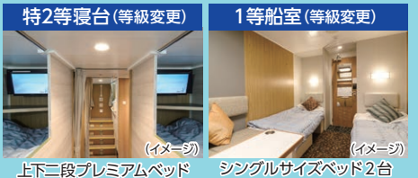
上下二段プレミアムベッド シングルサイズベッド2台