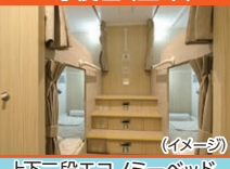
上下二段エコノミベッド