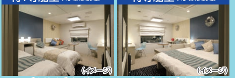
シングルサイズベッド2台 キングサイズベッド1台