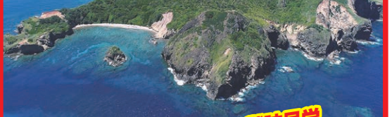
母島全景(イメージ)