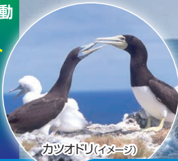
カツオドリ(イメージ)