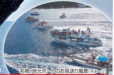
名物・地元ポートのお見送り風景(イメージ)