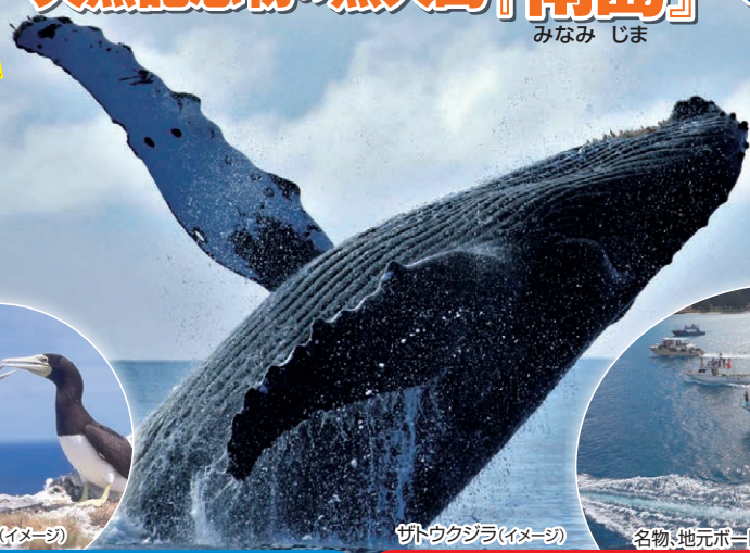
ザトウクジラ(イメージ)