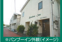
※バンブーイン外観(イメージ)

〈利用予定宿泊施設〉 バンブーイン またはログハウス星の詩 または父島ビューホテル