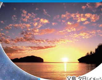
父島 夕日(イメージ)

世界自然遺産 ジャングル&フィールドウォーク 地元ネイチャーガイドが世界自然遺産区域の 森の中をご案内!