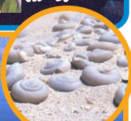
ヒロヘンカタマイマイ (イメージ)