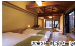
客室の一例(イメージ)