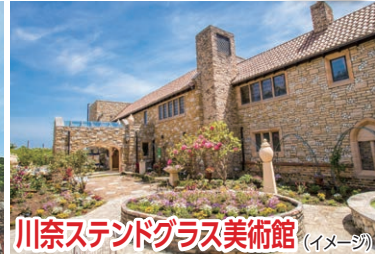
川奈ステンドグラス美術館 (イメージ)