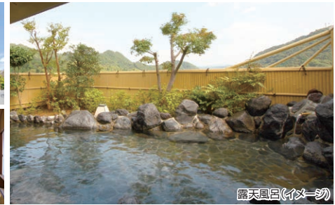
露天風呂(イメージ)