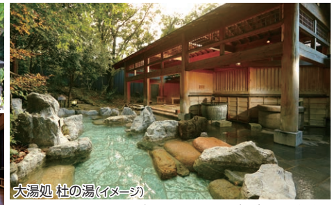
大湯処 杜の湯(イメージ)

大浴場には壺風呂や打たせ湯など10種類の多様な湯船が並びます。四季の自然と調和する露天風呂では「美肌の湯」とも称される源泉の湯も愉しみます。