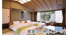
客室の一例(イメージ)